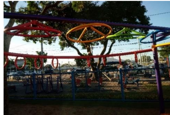
Figura 2: Brinquedos do parquinho infantil