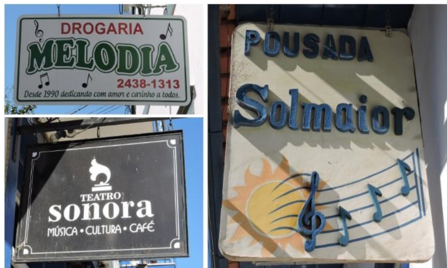
Figura 02: Estabelecimentos que remetem a música.

O projeto Conservatória, em toda casa uma canção, ainda que não fosse a intenção dos irmãos Freitas a época, são uma forma de perpetuar a cultura dominante da serenata e das músicas românticas brasileiras. Ainda que os símbolos existentes em Conservatória não sejam tão marcantes na paisagem, eles estão sempre presentes. Para qualquer lugar que você olhe em Conservatória, sejam placas nas casas, o nome dos locais, ou estabelecimentos comerciais, todos remetem a música de uma forma geral (Drogaria Melodia, Pousada Sol Maior, Pousada A Violeira, Pousada Chão de Estrelas, entre outros). Todas as paisagens são simbólicas (RAPOPORT apud COSGROVE, 2012, p. 230).