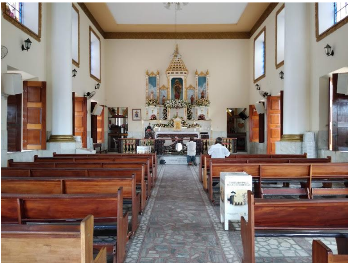
Figura 2 – Túmulo do Padre Cícero (Capela de N. S. P. Socorro)

A capela de N. S. P. Socorro se emana como transcendente para o romeiro pertencente ao catolicismo popular sertanejo, não por ser um templo sagrado ligado à Igreja Católica, assim como tantos outros existentes em Juazeiro do Norte. Essa igreja tem uma força transcendental ímpar para o romeiro, pois é neste local onde se encontra o túmulo do Padre Cícero (Figura 2).