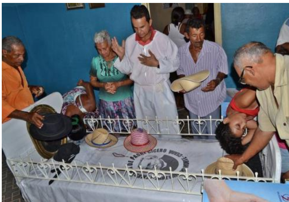
Figura 3 – Romeiros em frente à cama do Padre Cícero

No dia da morte do padre, em 20 de julho de 1934, o Casarão ficou envolto de milhares de fiéis que queriam se despedir do “padim” e prestar-lhes suas últimas homenagens. A cama onde veio a falecer ainda hoje se encontra exposta em seu quarto. Nas visitas realizadas pelos romeiros, a cama é um dos lugares de grande valor simbólico no rito realizado por eles. Muitos, ao adquirirem nas feiras e comércio ao redor do casarão objetos religiosos ou mesmos outros objetos não-religiosos, dirigem-se ao Casarão do Padre Cícero, vão até sua cama e passam os objetos na cama do “padim” com o propósito de benzê-lo (Figura 3).