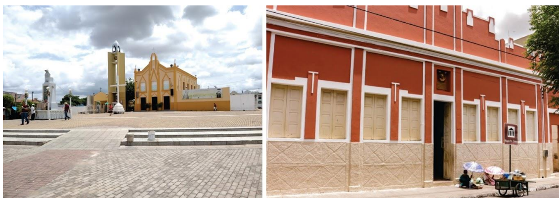
Figura 1 – Igreja do N. S. do Socorro e Antigo Casarão do Pe. Cícero

(ii) O antigo Casarão do Padre Cícero, que guarda suas relíquias e que se reveste de sacralidade na mentalidade do crente sertanejo do catolicismo popular sertanejo, com base na concepção do Messias que é assumida pelo Padre (Figura 1).