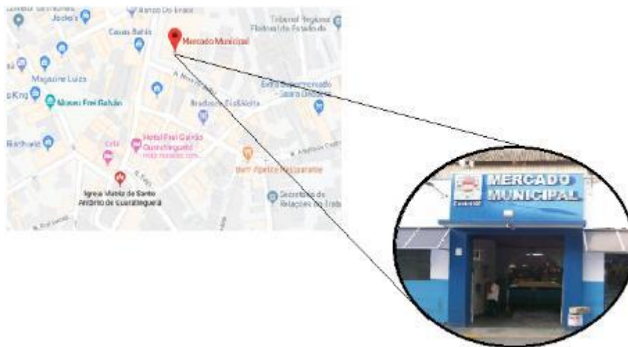
Figura 5: Localização Mercado Municipal de Guaratinguetá