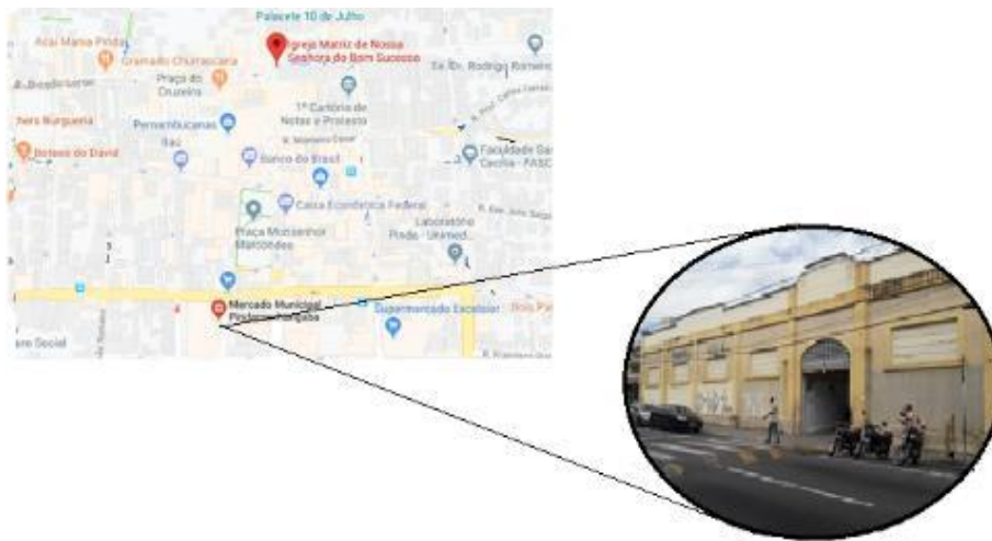
Figura 4: Localização Mercado Municipal de Pindamonhangaba