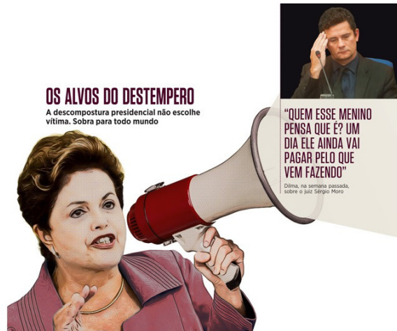
Figura 2 – Os alvos do destempero