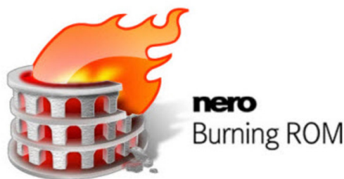
Figura 5 – Nero: Burning ROM