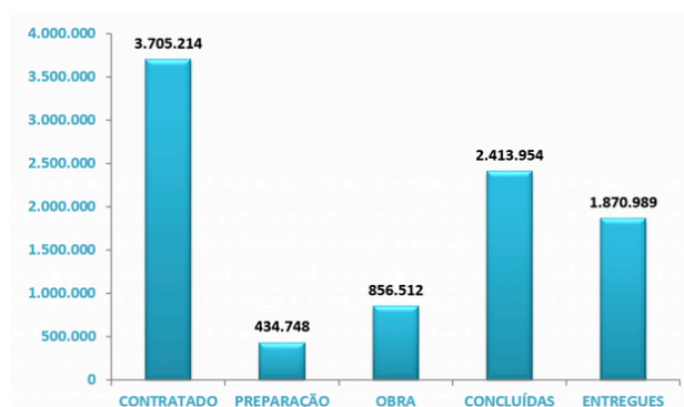
Figura 2. Números do Programa Minha Casa Minha Vida de 2009 a novembro de 2014

Assim, “[...] em um período de dez anos, consolidou-se um forte mercado imobiliário no país, com ampliação de acesso de famílias de renda mais baixa por meio de subsídios. Ao final de 2013, o PMCMV atingiu a marca de três milhões de unidades contratadas” (DIAS, 2014, p. 8) com um montante de R$ 234 bilhões entre 2009 e 2014 (CAIXA, 2014). A Caixa Econômica Federal contrata construtoras para efetivar as obras requeridas, mas os dados referentes à contratação não implicam entrega dos empreendimentos finalizados. Isto significa que foram efetivamente construídas e entregues às famílias, até julho de 2014, 1 milhão e 700 mil moradias, beneficiando cerca de 6,4 milhões de pessoas (CAIXA, 2014).