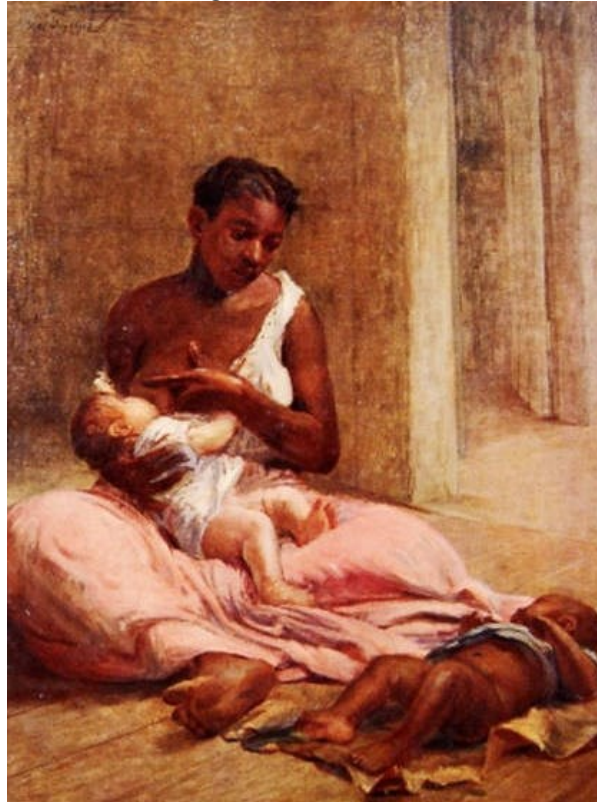
Figura 1 – Mãe Preta