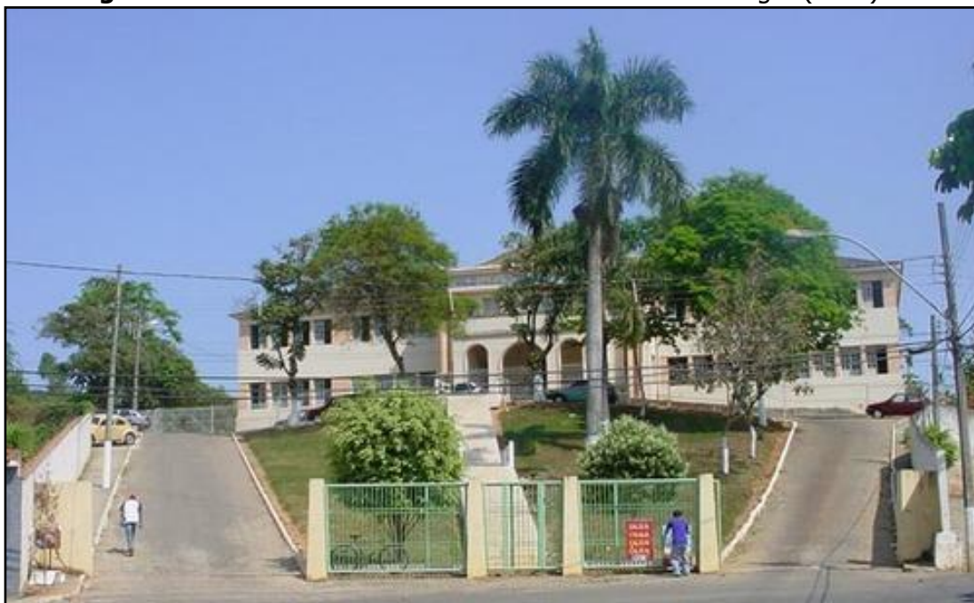
Figura 1 – Prédio onde funcionava a Escola Normal de Alegre (2007)

Há poucas informações sobre a Escola Normal Municipal de Alegre. O que sabemos é que teve sua primeira turma formada em 1933, ano que realizou seu pedido de equiparação oficial ao Colégio Pedro II, pedido apresentado em solenidade em 12 de novembro de 1933 (DIÁRIO DA MANHÃ, 12/11/1933; 20/12/1933). A equiparação ocorreu oficialmente no dia seguinte, por meio do Decreto nº 3.416, de 21 de dezembro de 1933. Atualmente, no prédio que sediava a Escola Normal funciona a Escola Estadual de Ensino Fundamental e Médio Aristeu Aguiar.