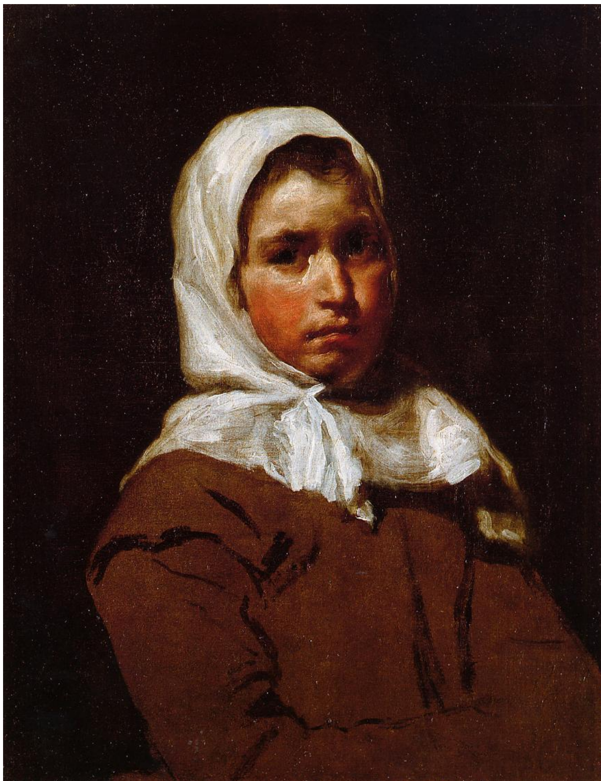
Diego Velázquez - Retrato de Criada (La Galega), Ca 1650, Óleo sobre Tela