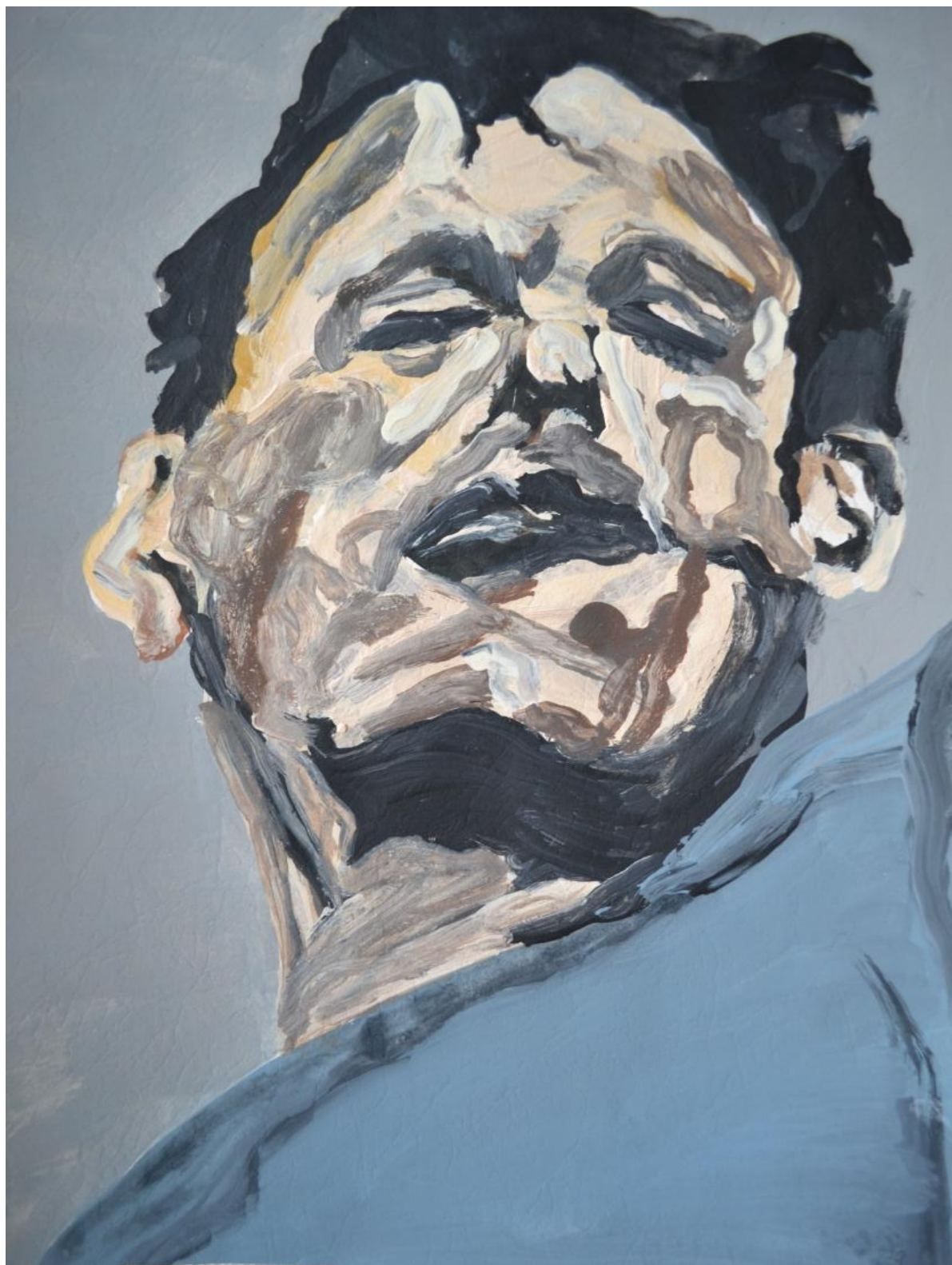
Referência Auto-retrato de Lucien Freud - 2013