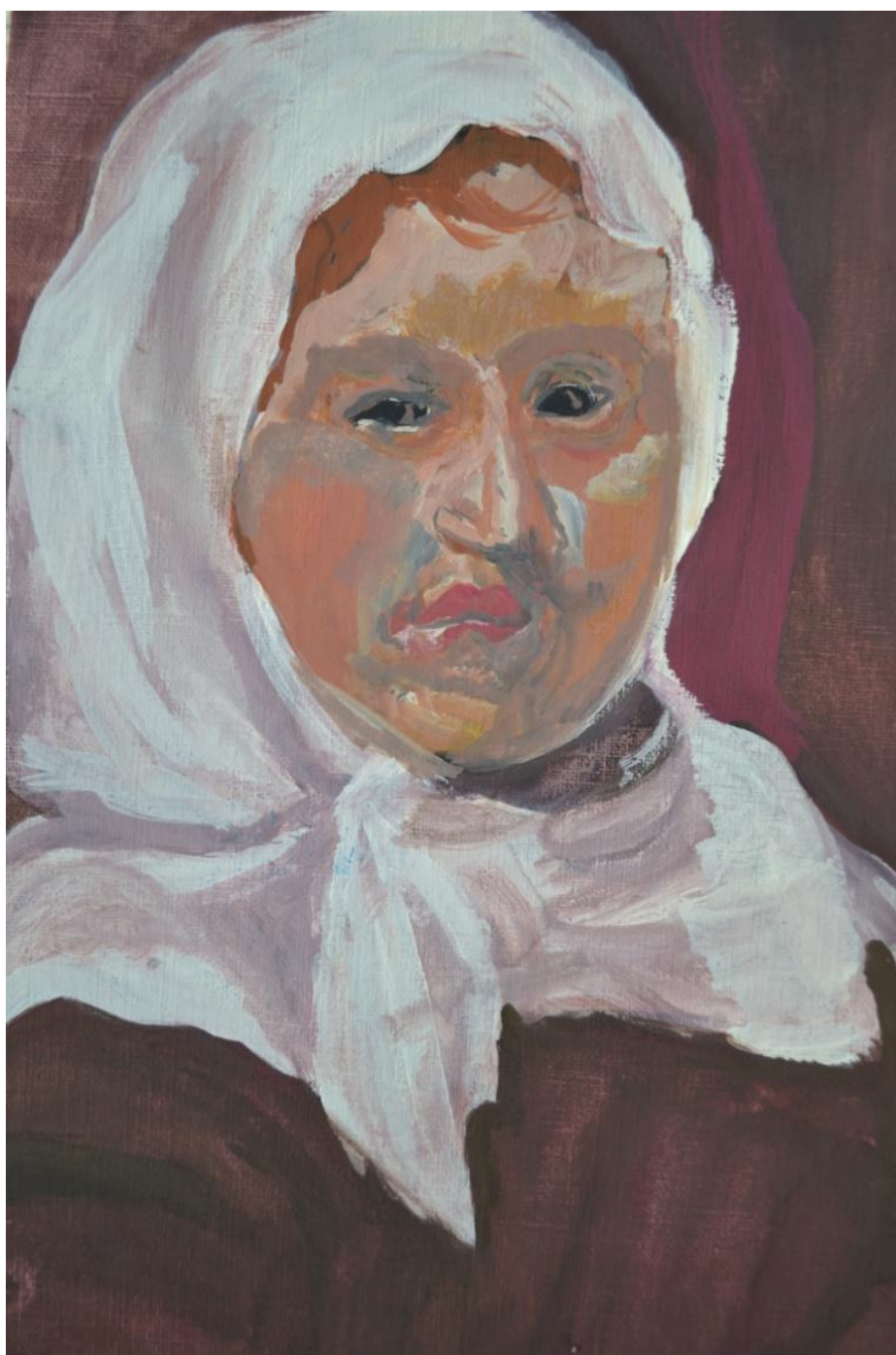
Referência Velázquez – A Camponesa - 2009

pelos artistas referenciados. Daí pode-se intuir como o aluno tem condições de criar de forma lúdica e leve em novos suportes, a partir da apropriação ou inspiração de imagens já existentes agregando novos e expressivos valores aos retratos.