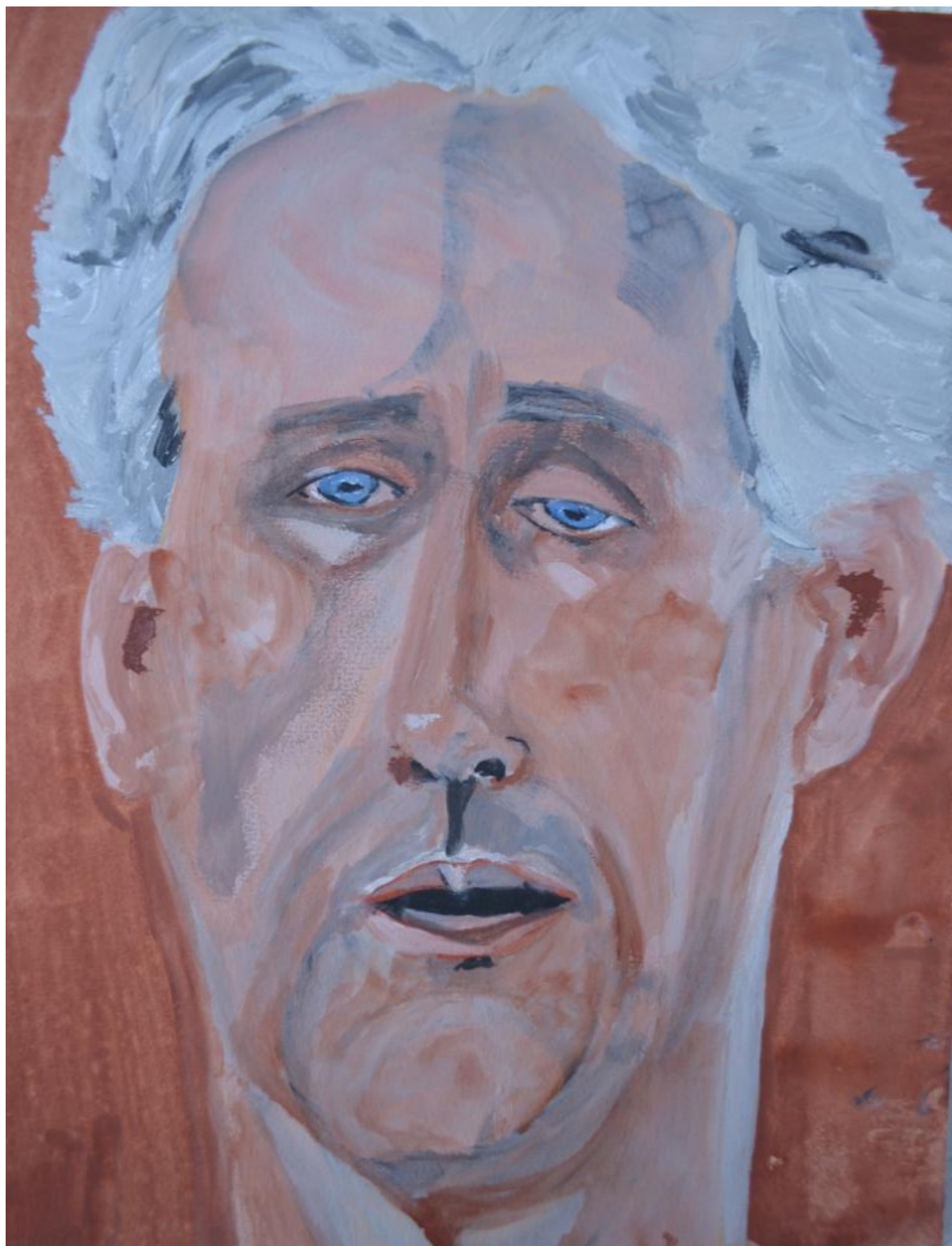
Sem Título – 2011, 0,30 x 0,20 cm, Guache sobre papel Obra vencedora do concurso de retratos da Exposição Modigliani Imagens de uma Vida – 2011