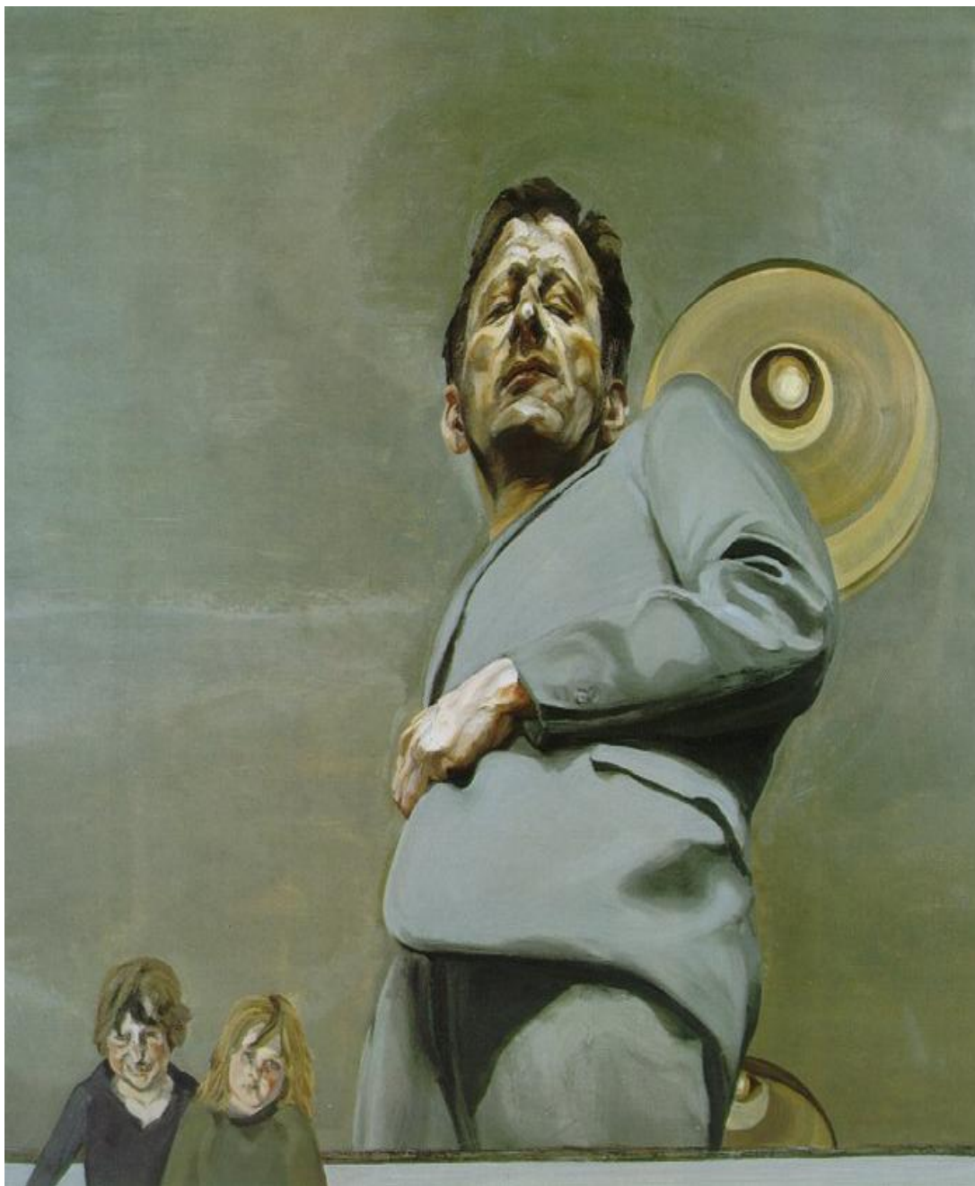
Lucien Freud - Reflexão com duas crianças (Auto-Retrato), 91 x 91 cm óleo sobre tela.