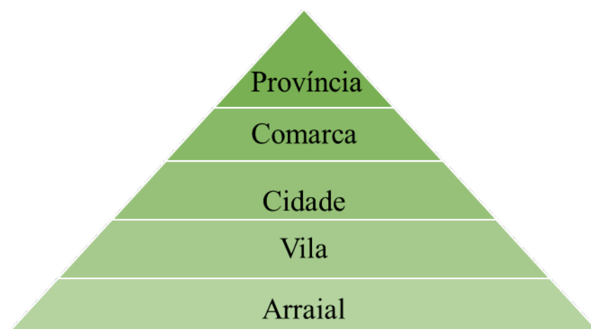
Pirâmide 1 – relação hierárquica entre os termos técnicos.

No que tange à terminologia utilizada na organização político-territorial do Brasil Imperial, coligimos que estas lexias estabelecem uma relação hierárquica entre si. Desse modo, no intento de facultar a compreensão acerca dos termos técnicos analisados e das relações que eles mantêm, apresentamos, primeiramente, uma pirâmide, em que estes vínculos são evidenciados.