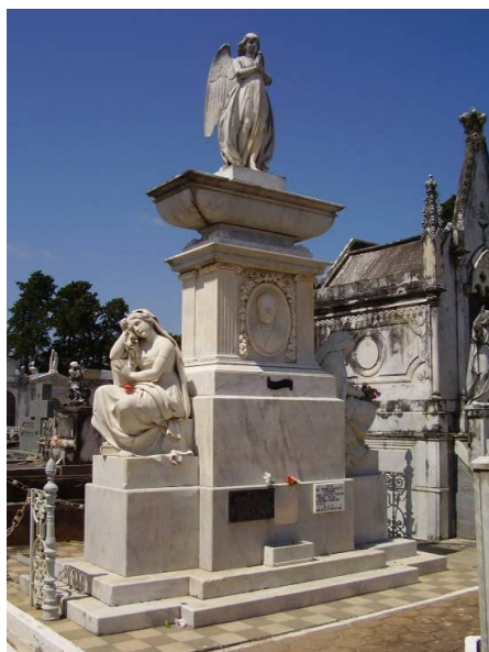
Figura 4: Túmulo de General Antônio de Souza Netto. Detalhe: Medalhão, envolto por guirlanda, com busto em relevo do General Netto, flanqueado por duas colunatas com capitéis jônicos, em que se fez representar como civil e não como militar.

O predomínio luso-brasileiro pode ser verificado também numa abordagem qualitativa. O cemitério de Bagé se destaca por alguns monumentos da chamada memória pública, que funcionam como monumentos de heroização de grandes vultos da história política e, sobretudo, militar. Podemos citar o túmulo do General Antonio de Souza Netto, grande líder farroupilha 6 . (Figura 4)