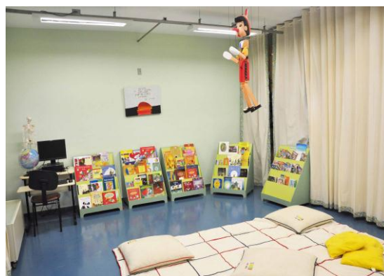
Figuras 4 e 5: Espaços da UMEI. Espaço Faz de Conta localizado no hall de entrada e sala multimeio.