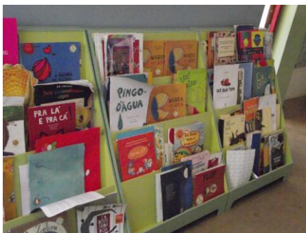
Figura 6: Espaço da biblioteca no início da pesquisa.

Além da quantidade, a qualidade dos livros e a diversidade do acervo devem assegurar o que se tem denominado Bibliodiversidade . Segundo Carrasco (2015), bibliodiversidade é a pluralidade de tipos, gêneros, estilos, épocas, escritores, ilustradores, que constituem um determinado acervo e que estabelece relativa complexidade para favorecer tanto uma leitura autônoma, quanto a leitura mediada pelo professor.