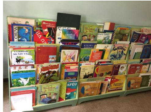
Figuras 9 e 10: Espaços da UMEI. Sala de atividades de crianças de cinco anos e biblioteca.