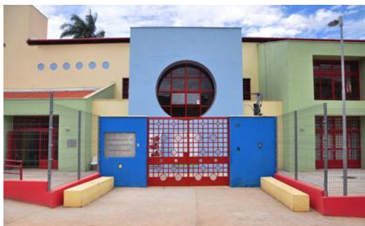
Figura1 - UMEI parceira da pesquisa.

As Unidades Municipais de Educação Infantil (UMEIs) são instituições educativas criadas e mantidas pelo poder público municipal para atender crianças na faixa etária dos quatro meses aos cinco anos e oito meses. A UMEI parceira do Projeto localiza-se na região da Pampulha 1 , em Belo Horizonte, e possui arquitetura similar às demais unidades que integram a política de expansão da rede pública de Educação Infantil do município iniciado nos anos 2000.