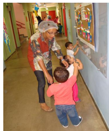
Figuras 2 e 3: Espaços da UMEI. Sala de crianças de três anos e corredor, com móveis e painéis feitos pelas famílias e crianças.

A decoração das salas de atividades e dos espaços coletivos da UMEI foi, portanto, resultado de uma estratégia que visava propiciar que as famílias, os professores e demais profissionais da instituição se conhecessem e compartilhassem um tempo e um espaço de convivência e de acolhimento recíprocos.