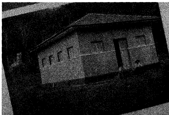
Figura 2 - Modelo de grupo escolar rural com uma sala de aula