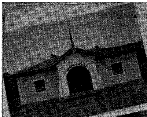
Figura 1 - Modelo de grupo escolar rural com duas salas de aula

[essa] escola da roça ou da cidade era a única, e na ausência de outra, a melhor opção para a [apropriação] dos rudimentos da cultura escrita” (SOUZA, 2009, p. 155).