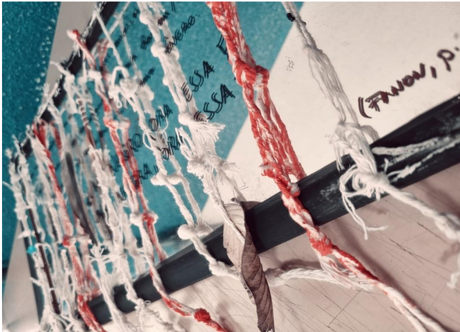
Figura 3. Quipus da violência colonial

desumaniza, produzindo uma experiência corporal marcada pela alienação e pela violência simbólica. Trata-se de um processo no qual o sujeito é reduzido à sua corporalidade racializada, tendo sua existência constantemente mediada por estereótipos e expectativas impostas pelo mundo colonial.