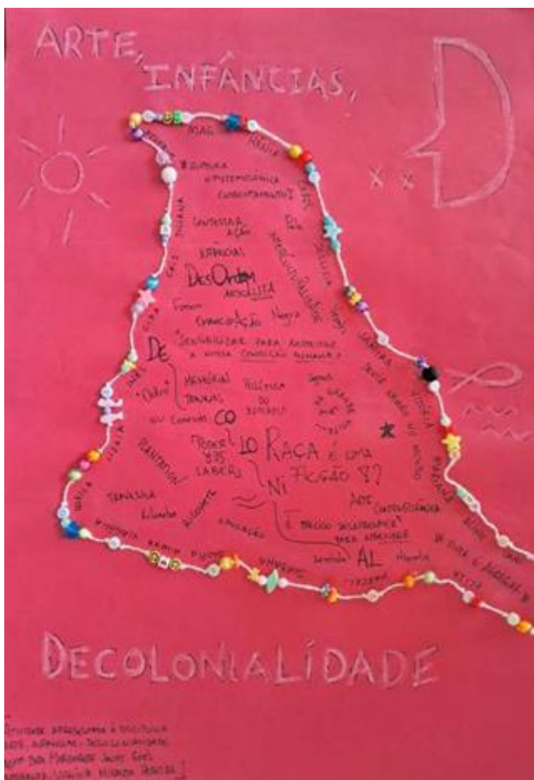
Figura 2. Arte, Infâncias e Decolonialidade

curricular, na medida em que interpela a organização do conhecimento escolar e questiona os referenciais que historicamente orientam e normatizam a Educação Física.