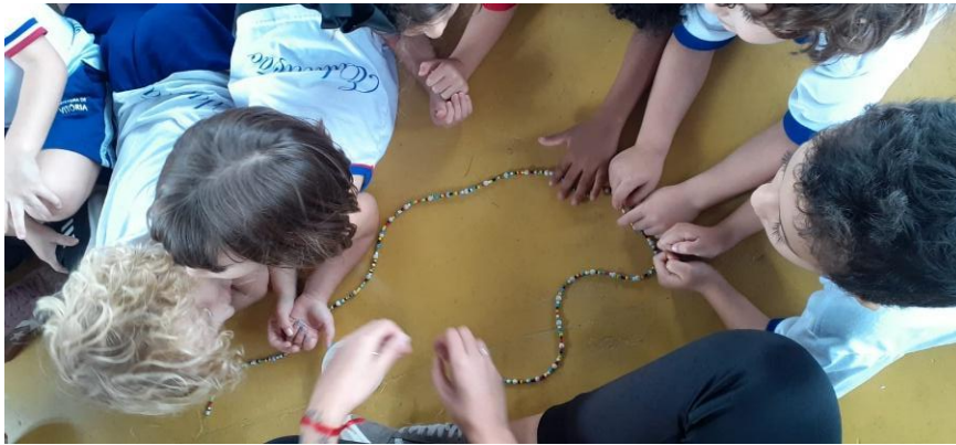
Imagem 03. Desenvolvimento atividade 3 (2023)