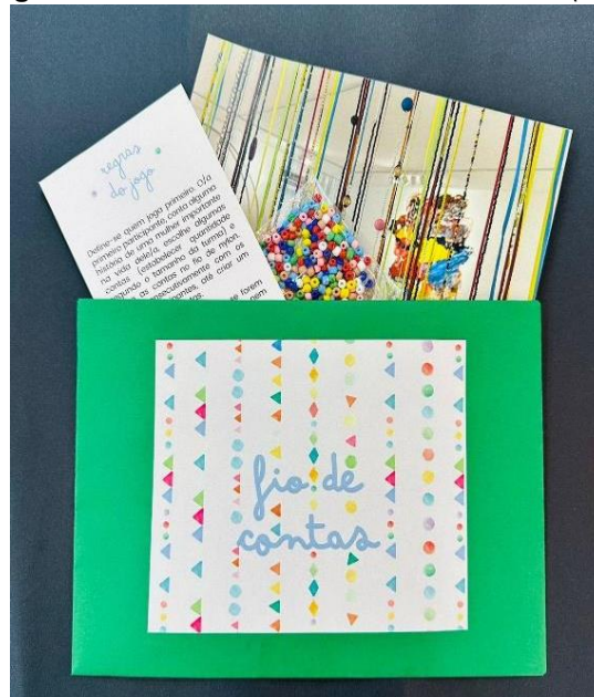
Imagem 04. Material educativo Fio de Contas (2023)

Durante a atividade, as crianças se sentaram em roda e, uma a uma, compartilharam suas histórias, inserindo as contas no fio de nylon com cuidado e atenção, o que também favoreceu o desenvolvimento da coordenação motora fina. Sobre a importância da contação de histórias, hooks (2020, p. 89) destaca que “contar histórias é uma das maneiras que temos para começar o processo de construção de comunidade, dentro ou fora da sala de aula. Podemos compartilhar tanto fatos verídicos quanto histórias fictícias que nos ajudem a compreender uns aos outros”. Na narrativa das crianças, essa fusão entre histórias reais e imaginárias acontece com muita naturalidade, revelando a riqueza de suas experiências e a fluidez da imaginação no processo de aprendizagem.