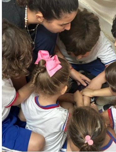
Imagem 02. Desenvolvimento atividade 1 (2023)