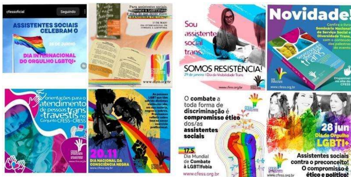
Figura 1: Publicações no Instagram relacionadas às LGBTI+00