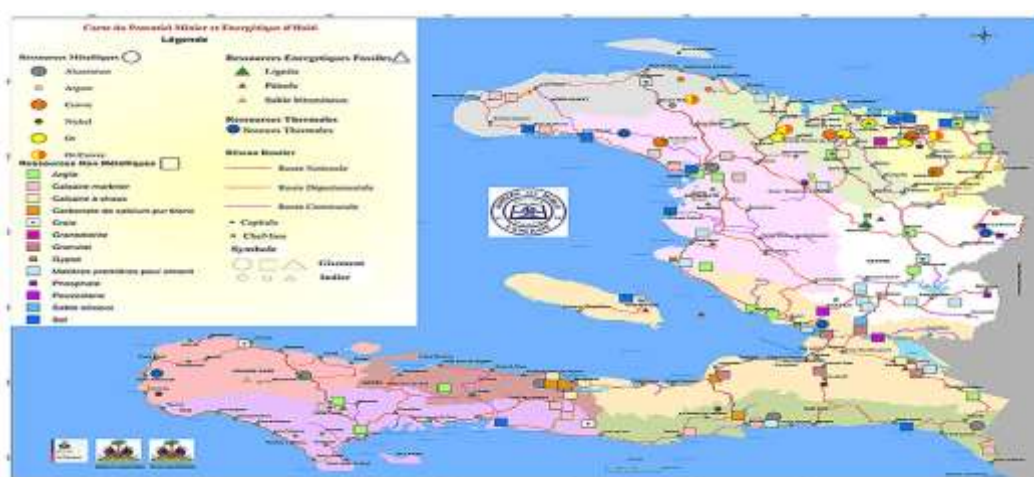
Figura 1 - Carta de potencial de minas e de energia no Haiti