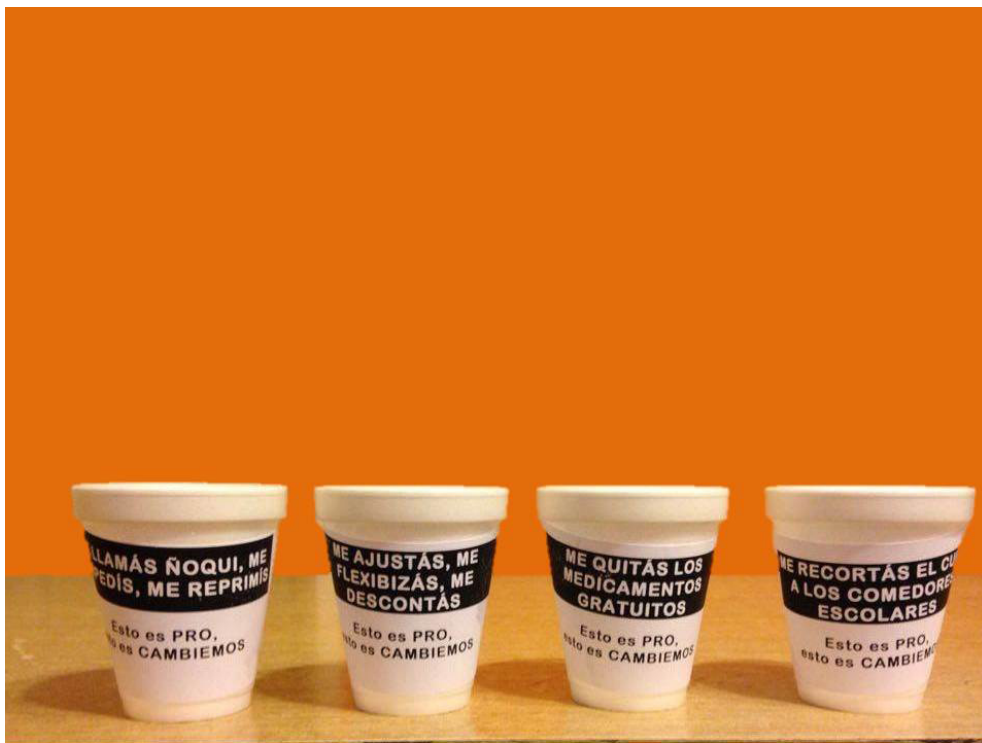
Figura 2. Vasos utilizados en la intervención en la Plaza Rivadavia, Bahía Blanca, 11-04-2016. Unificados por el texto “Esto es Pro, esto es Cambiemos”, se diferenciaban por la denuncia de distintas medidas gubernamentales macristas.

cabo un recorte presupuestario del cupo de los comedores escolares, descontado sueldos a 65 mil auxiliares docentes y reprimido la protesta social. Además, se preguntaban qué perspectiva de desarrollo social y educativo había para la ciudad, hasta dónde llegaba el ajuste dispuesto por un gobierno “que manda a comer ‘cualquier cosa’ a los chicos más pobres mientras transfieren recursos de los sectores más vulnerables a los más concentrados” (A&E: 12-04-2016).