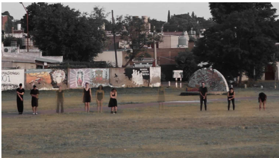
Figura 5. Acción Urgente, Memoria, Verdad y Justicia, Bahía Blanca, 28-12-2017.