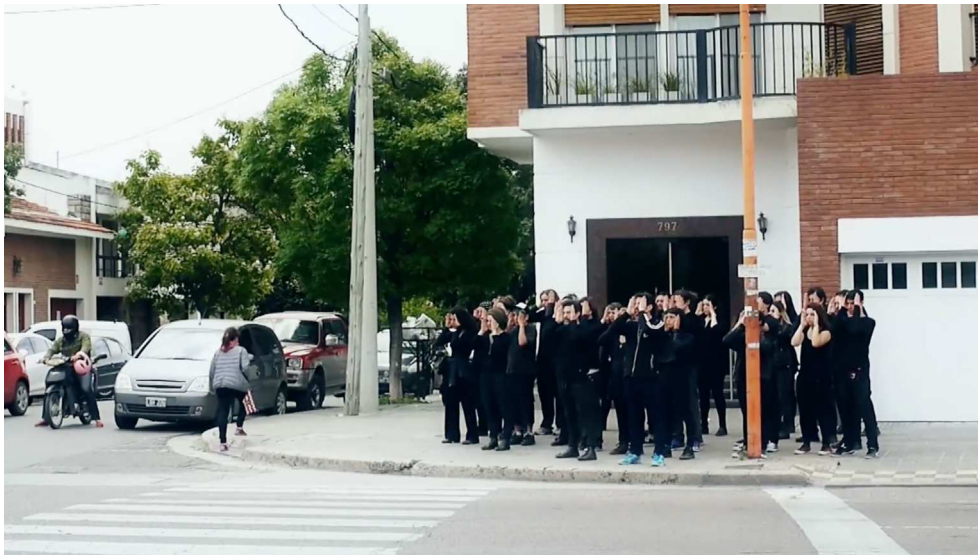
Figura 3. Acción Urgente, Ejercicio #01 - Panorámico, Bahía Blanca, 21-11-2017.