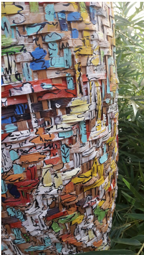
Kagrá 2. Fotografia deTadeu dos Santos, 2020.

vähã tĩ vĩ rán vë, ti tỹ rán ja vë vënhrá tỹ SEED(...) han ja ký tóg inh mý sér tĩ isỹ gir ag kanhrãñ jãfã ki”.