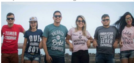
Figura 6. Exemplo do estilo bregoso.

e apenas entendidas por aqueles com capital cultural na cena, como: - Temer, + Troinha,