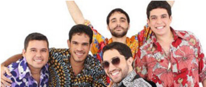
Figura 5. Brega Universitário, grupo Faringes da Paixão.

elevados não correspondeu a uma decadência do brega. Como acima falamos, a música continuou a ser consumida num circuito alternativo, sempre se atualizando a novos estilos e a novas formas de gravação e divulgação. E progressivamente os públicos deixaram de estar restringidos às periferias das grandes cidades de Pernambuco, como Recife e Belém, e passou a chegar a públicos cada vez