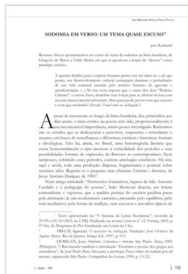
Capas e páginas iniciais da publicação em revista (2005) e livro (2013) do artigo “Sodomia em verso: um tema quase escuso”, de Wilberth Salgueiro.