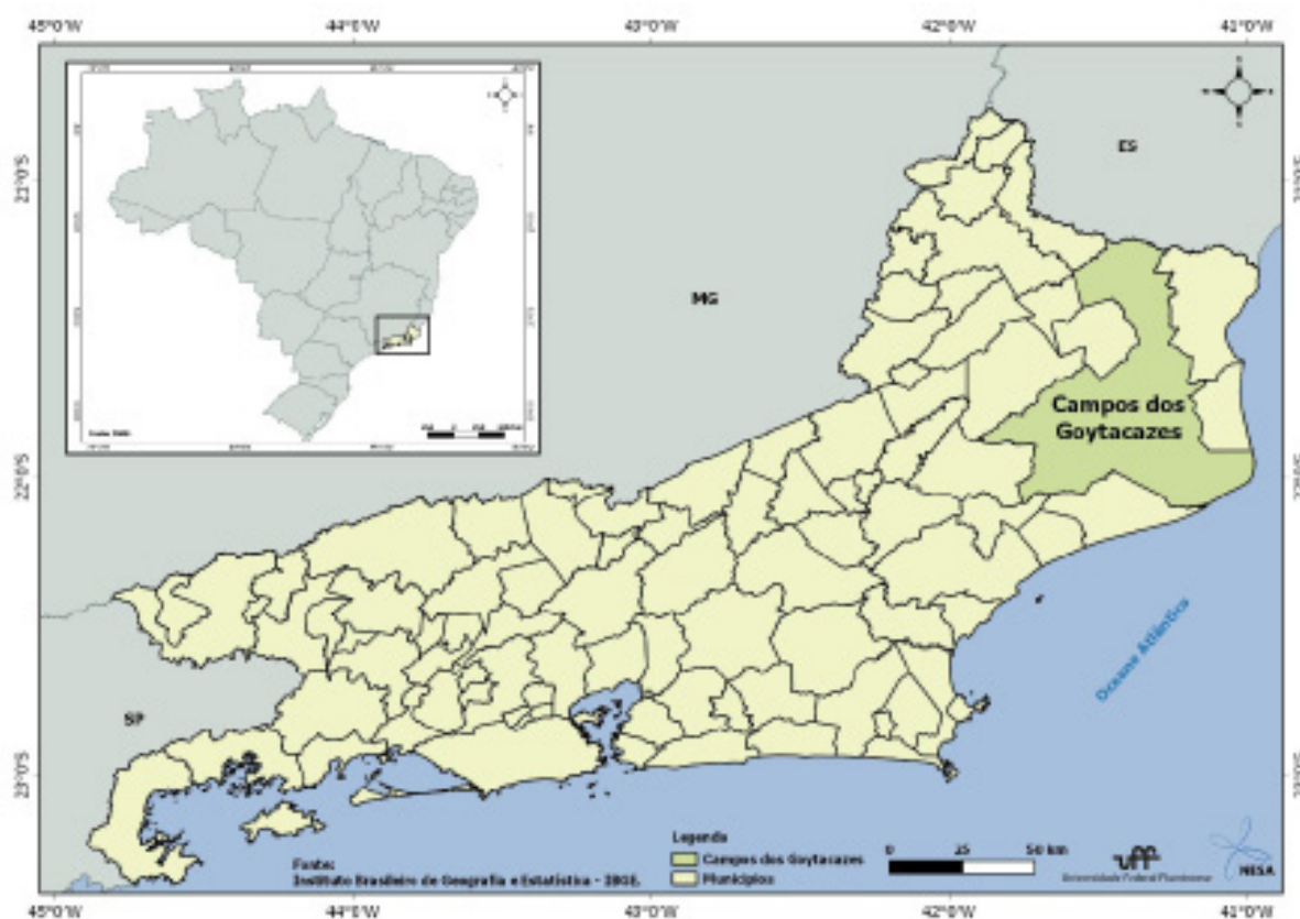
Figura 1: Localização do Município de Campos dos Goytacazes no Estado do Rio de Janeiro.

ram diretamente nas condições de vida da população como um todo: o IDH-M (Índice de Desenvolvimento Humano Municipal) no ano de 2010 era 0,716. Apesar de ter apresentado uma melhora em relação ao ano de 2000, quando alcançou 0,618, é possível inferir que tal desempenho se deve ao peso do aumento da esperança de vida. Isso porque, no se que se refere à apropriação da renda, em 2000, 20% da população mais pobre detinha apenas 3,2% da renda, e, em 2010, esse percentual ficou em 3,3%, ou seja, ainda muito baixo. Durante o mesmo período, os 20% mais ricos diminuíram, porém muito pouco,