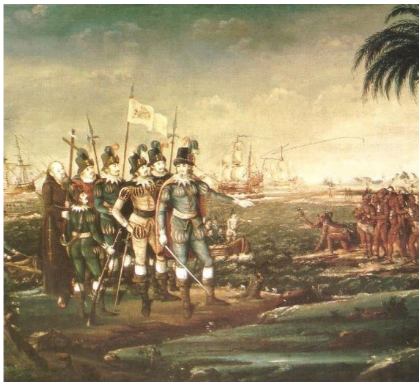
FIGURA3 - “O desembarque de Cristóvão Colombo no Novo Mundo”

Atentando-nos à dimensão da imagem, o livro Jornadas. Geo opta por utilizar o quadro “O desembarque de Cristóvão Colombo no Novo Mundo” 3 , de Frederick Kimmelmeyer (Figura 3). Na imagem, percebemos a representação de europeus e povos originários no momento da invasão de Cristóvão Colombo. Europeus são representados em primeiro plano, em escala bem maior, altivez e sinal de dominação. No mesmo cenário, percebemos povos originários representados fisicamente de maneira a reforçar estereótipos, em segundo plano, escala menor e em posição de súplica e subalternização. Tal imagem reforça o estigma de superioridade europeia, ocultando a violência do momento da invasão e o imaginário do conformismo acerca dos então habitantes do que viria a ser chamado de América.