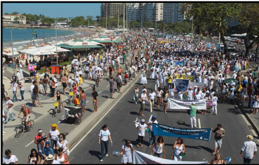
FOTO 1: Caminhada em Defesa da Liberdade Religiosa, Praia de Copacabana, 2016