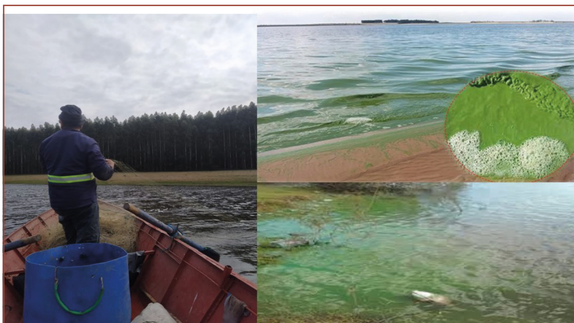
Figura 4 – Actividades del agronegocio en el territorio de pesca artesanal