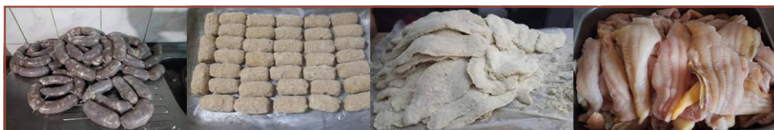
Figura 3 – Productos que le dan valor agregado al pescado