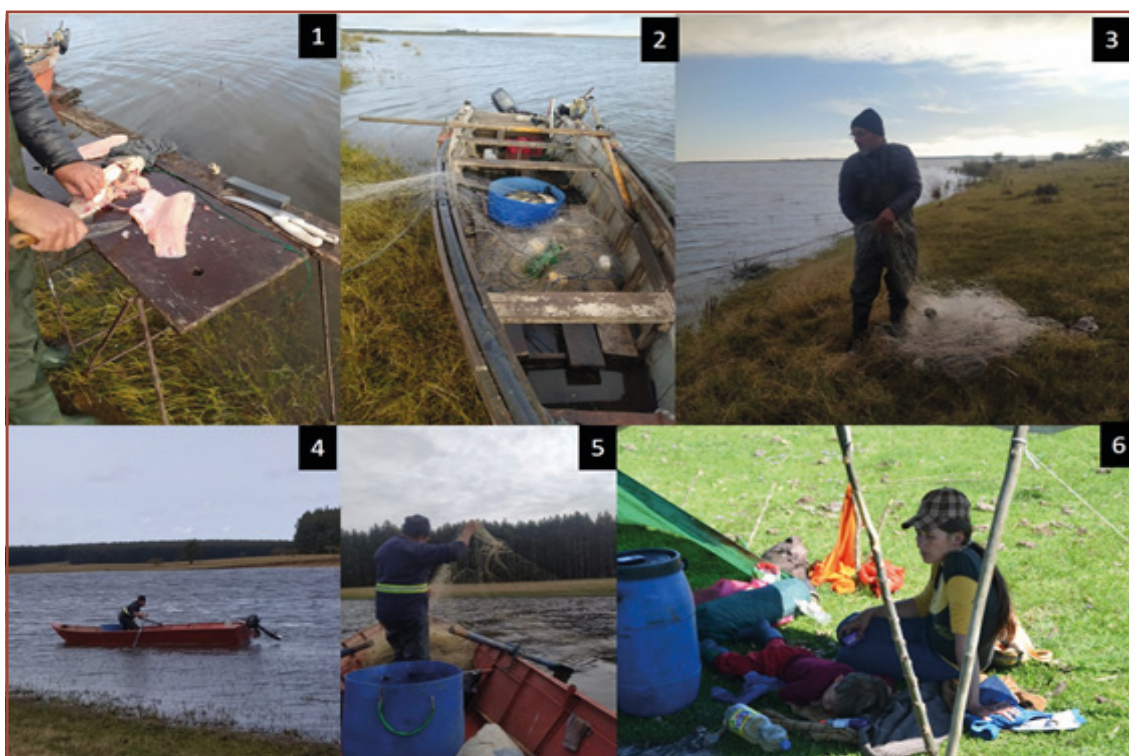
Figura 2 – Actividades de la pesca artesanal