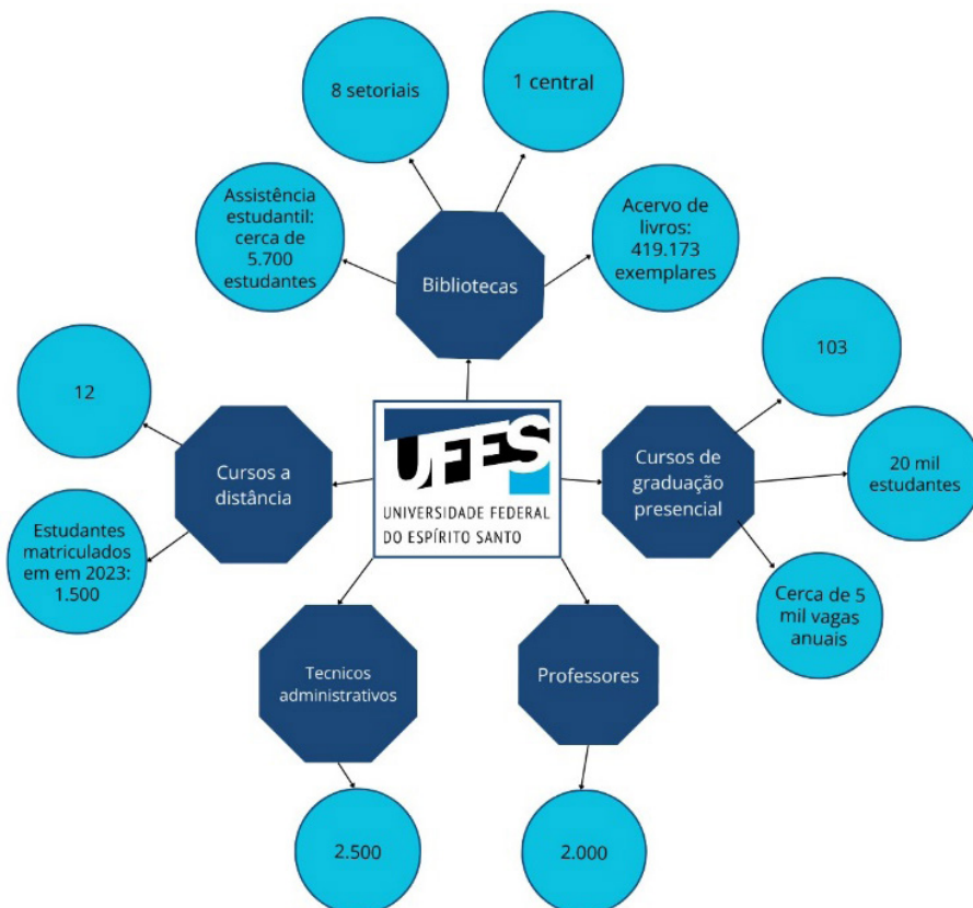
Figura 2 - Quantitativo de funcionalidades da Ufes