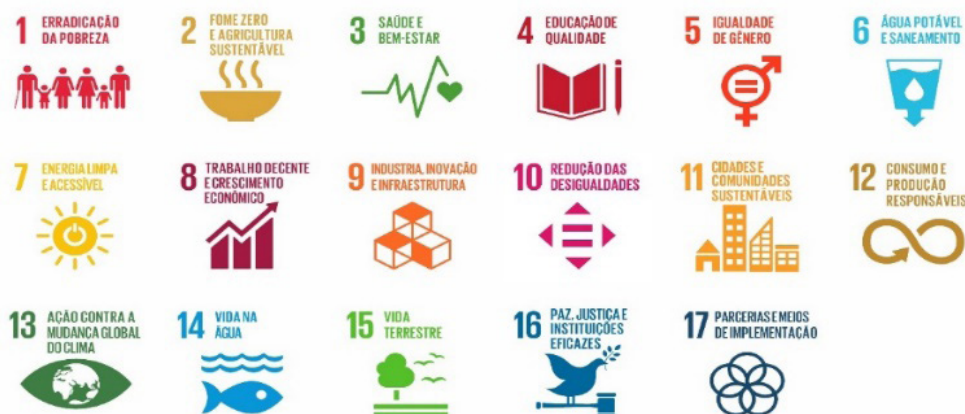
Figura 3 - Os 17 Objetivos de Desenvolvimento Sustentável da Agenda 2030

Pesquisa Econômica Aplicada – Ipea (2018), pois os 17 ODS (Figura 3) foram elaborados em linguagem universal e cada país adaptou suas metas conforme à própria realidade, destacando: