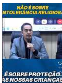
Imagem 5: Poste em rede social e trecho de discurso proferido na tribuna