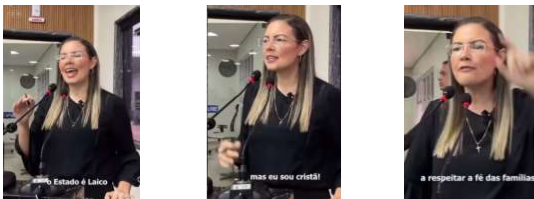
Imagem 4: Discurso proferido na tribuna.