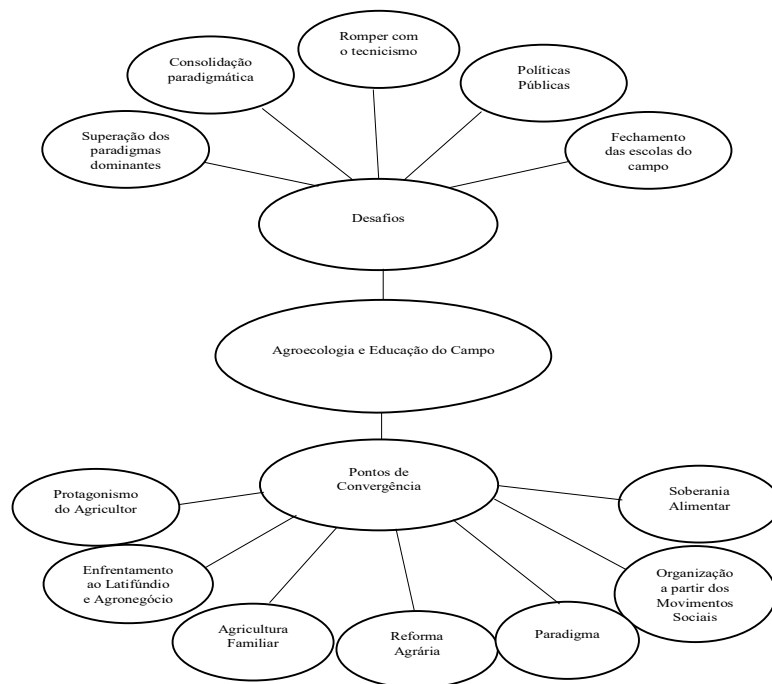
Figura 1: Pontos de Convergência e Desafios entre Agroecologia e Educação do Campo/Pedagogia da Alternância

No Brasil, a agroecologia e a educação do campo coexistem e são inseparáveis, portanto é possível traçar pontos de convergência e desafios entre a educação do campo e agroecologia, conforme indicado na figura 1. Um dos pontos de convergência é atuar com intenção de transformar a realidade, através de sua problematização, faz parte da agroecologia assim como da educação do campo, produzir conhecimento científico através dos saberes populares afirmando práticas e metodologias próprias e apropriadas aos camponeses. Portanto, apresentamos na figura 1 uma sistematização dos aspectos desafiadores e convergentes destas duas matrizes tão importantes para o campesinato.