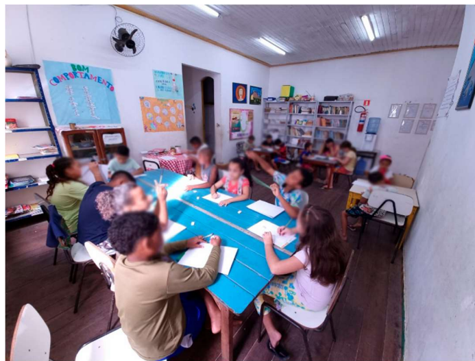
Figura 2 - Pesquisa de campo para observação do espaço, compreensão dos detalhes, com o intuito de dar uma nova dimensão ao entendimento que todos tinham não só da história, mas também do espaço físico.

A confecção dos materiais para estudo, se deu a partir de uma necessidade apontada em uma de nossas rodas de conversa, de conhecer melhor o espaço que seria apresentado pelos guias. Nessa conversa, chegou-se à conclusão de que apesar de todos ali conhecerem o espaço Porto, eles nunca tinham olhado realmente para ele. Conversamos sobre as formas de olhar para um local, as formas de se perceber as nuances, as cores, os cheiros, o clima. Uma das disciplinas da grade do curso de Pedagogia, é a de História e Geografia, e foi nessa disciplina que eu aprendi a trabalhar as questões de percepção, e esse conhecimento foi fundamental para nortear