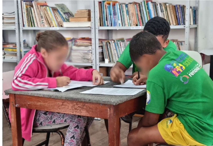
Figura 3 – Tentativa inicial de criar um roteiro para a visita guiada, quais casarões seriam apresentados, ordem da visitação, em que lugar ela se encerraria, quais histórias seriam contadas, etc.

A etapa de se criar um roteiro turístico, talvez tenha sido mais divertida, afinal, todas as crianças queriam colocar suas ideias e foi preciso pensar de forma coletiva, para que se chegasse a um ponto comum entre as ideias de todos. Foram escolhidos 3 (três) locais que obrigatoriamente fariam parte do roteiro, o casarão onde funciona o Centro Social, o Chafariz, e o Cais do Porto. O casarão onde funciona o Centro Social, ficaria por último, pois lá teria uma surpresa extra para os visitantes, a exibição do museu que eles mesmos iriam produzir junto a outra estagiária que também estava elaborando um projeto para resgate cultural. Apesar das discussões, não conseguimos chegar a um resultado final até o presente momento, e é importante ressaltar que o projeto ainda está em construção.