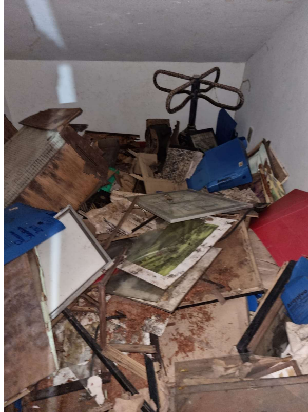
Figura 4 – Entulhos encontrados em um dos quartos do casarão ao lado da sede do Centro Social. Nele foram encontradas diversas peças históricas, principalmente, fotos e quadros. Também foram achados documentos datados de vários anos, o mais antigo catalogado por nós era de 2009, então não se enquadra nos itens históricos.

Esse casarão ao lado, foi anexado ao Centro Social, e nele foram encontradas diversas peças que deveriam estar nos museus, porém, foram abandonadas ali e amontoadas com todo tipo de lixo. Nos entristeceu muito ver o descaso com que as autoridades tratam o patrimônio histórico do nosso município e, em paralelo, a tristeza dos funcionários do Centro, ao verem essa parte da história sendo deliberadamente pagada. Começamos um trabalho de recuperação e catalogação das peças encontradas, contudo, pelo avançado estágio de decomposição de muitas das obras, optamos por não mexer muito, e apenas separar o que era lixo, do que era patrimônio histórico e cultural. Fizemos um trabalho de conscientização com as crianças nessa etapa, pois é importantíssimo que elas compreendam a gravidade da situação encontrada, para que também abrisse seus olhos para o todo da comunidade.