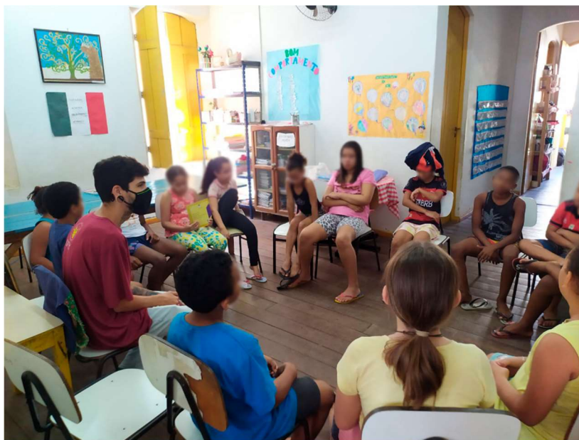
Figura 1 – Roda de conversa, onde buscamos compreender o papel dos guias turísticos e iniciar as pesquisas acerca do espaço Porto.

Esse foi um momento muito especial, as crianças me surpreenderam positivamente ao contarem inúmeras histórias sobre o bairro, sobre as batalhas travadas no rio Cricaré. Foi um momento de muito aprendizado, eu particularmente, não estava familiarizado com mais da metade do que foi dito ali pelas crianças e, apesar de faltarem alguns nomes dos personagens históricos que inevitavelmente elas esqueciam, a forma como contavam,