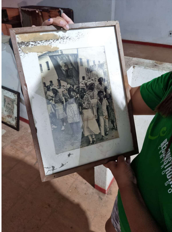
Figura 4.1 – Uma das crianças do Centro Social, observando uma das fotos encontradas em meio aos entulhos.