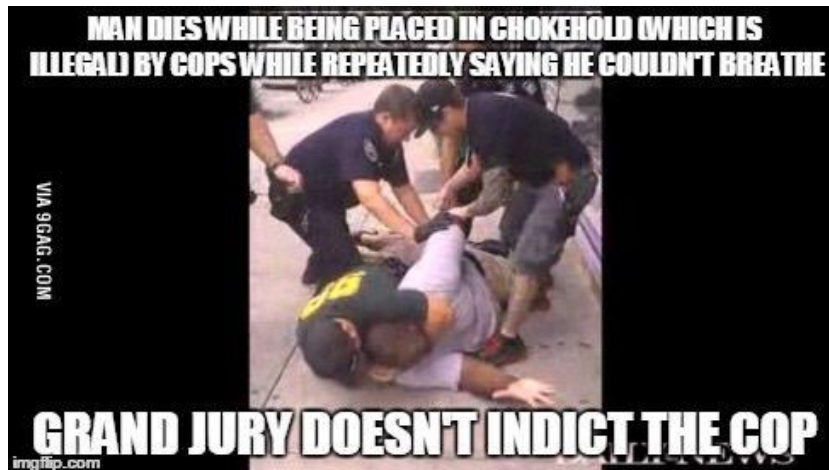
Figura 3: Meme 2