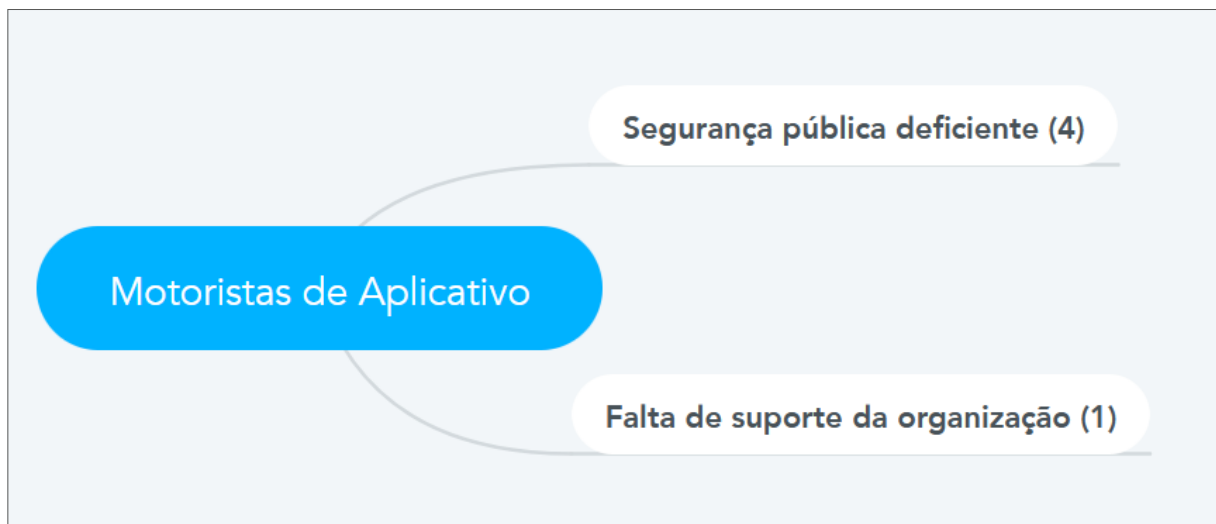
Figura 3 - Percepções sobre condições de trabalho - Motoristas de Aplicativo

Fonte: Elaborada a partir dos dados da pesquisa.