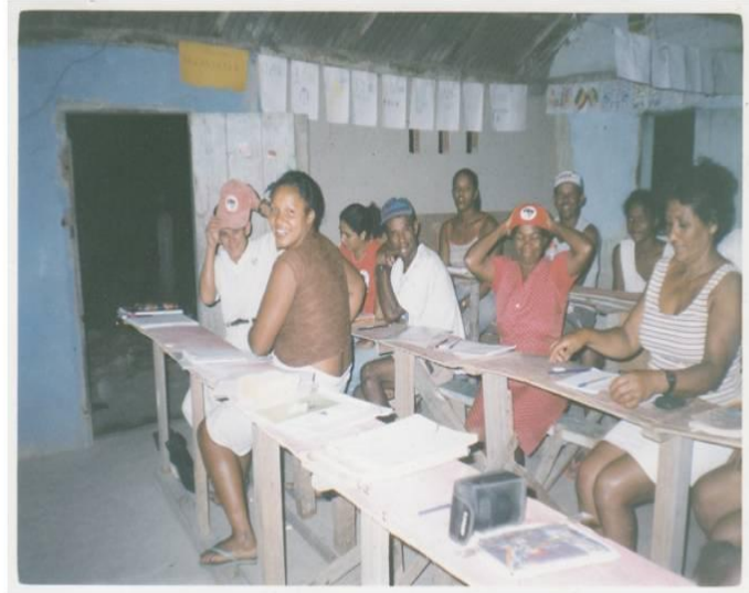
Imagem 2 - Estrutura da escola do acampamento Octaviano de Carvalho Fonte: Setor de Educação MST/ES (2005).

Para além das condições físicas das escolas, a concepção e organização do currículo, a falta de garantia (ou inexistência) de transporte intracampo, a falta de merenda para educandos e educandas dentre outras questões dificultam a efetivação educação no campo como direito aos sujeitos. Destacamos também outras questões aparentemente secundárias (como a necessidade de educandos/educandas jovens e adultos levarem seus filhos para a escola) que são muitas vezes primordiais para permanência e conclusão (ou não) dos estudos. A imagem 3 (três) representa esse processo no qual educandos/educandas para conseguirem frequentar as aulas precisam dividir o tempo de estudo com o cuidado das crianças.