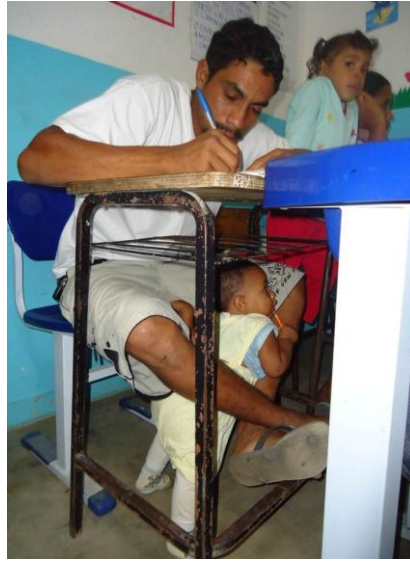
Imagem 3 – Educandos do ProJovem Campo Saberes da Terra Capixaba 5 e seus filhos durante aula Fonte: Equipe de formação ProJovem Campo Saberes da Terra Capixaba (2011).

Desse modo, retomamos a afirmação de Kolling, Néry e Molina (1999) que é necessário garantir atendimento diferenciado ao que é diferente, mas esse atendimento não deve ser igual, homogeneizar os sujeitos sem resguardar sua diversidade, suas necessidades ou estará se produzindo uma inclusão-excludente.