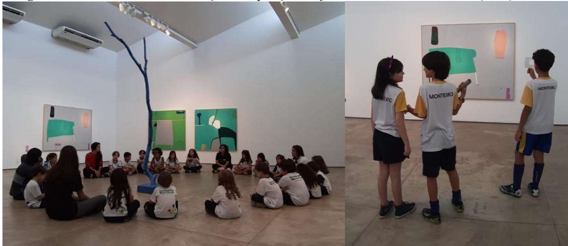
Imagens 03 e 04: Educativo com crianças na exposição Confluências em verde , Wolthers (2019), na MBac.

Segundo Basbaum (2007, p. 104), “[...] o trabalho contemporâneo estende-se sobre o espectador de modo ostensivo, demonstrando de maneira radical a impossibilidade de uma ‘contemplação indiferente’ [...]”, considerando a criança pequena que testemunha a arte contemporânea e se sente convocada a brincar, a fazer de conta, a fantasiar sobre as relações sociais e pessoais ali presentes, e também aquelas situações e relações que habitam outras esferas de sua vida, ela não aceita nenhum roteiro, ainda que semiestruturado, que possa impedir que corporifique novas bases de experiências significativas. Assim ocorreu na galeria Matias Brotas em vários momentos da edição do ArteCria , de 2019.